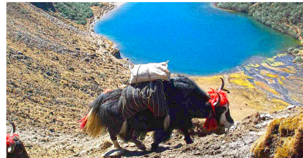
Druk Path Trek