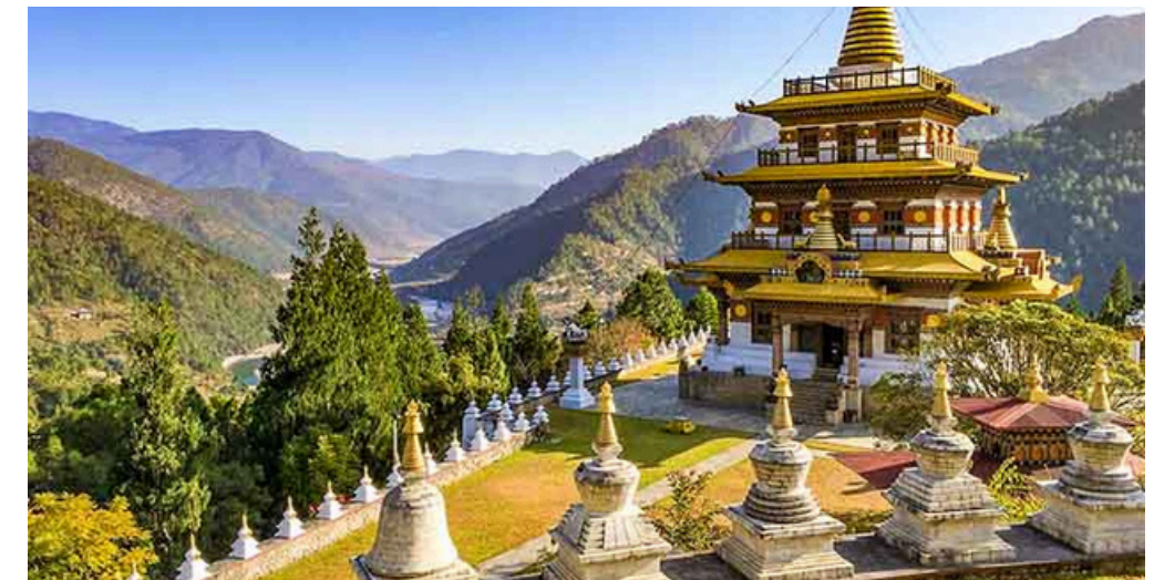
Nepal e Bhutan